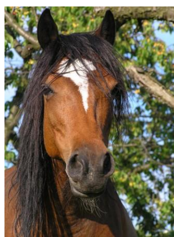
Western a koně očima dětí